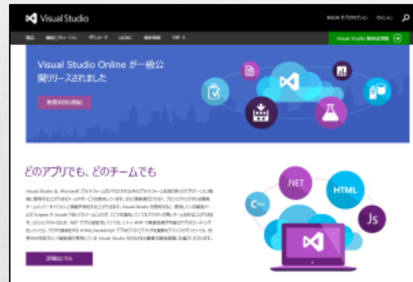
Microsoft Visual StudioのWebサイト